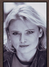
Conny Schmid Regie Bühnenentwurf